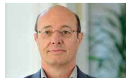
Louis Schelbert, Nationalrat LU Mitglied der Kommission für Wirtschaft und Abgaben

Die Anliegen der Initiative entsprechen den Forderungen im Weltagrarbericht und den UNO-Nachhaltigkeitszielen, die auch die Schweiz unterzeichnet hat. Das Ziel: Die globale Landwirtschaft soll ökologischer werden und vermehrt Kleinbäuerinnen und Kleinbauern ins Zentrum stellen. Die Zukunft liegt im nachhaltigen, fairen Handel. Davon profitieren die Menschen vor Ort und in der Schweiz – und das Essen schmeckt besser.