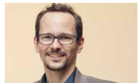
Balthasar Glättli, Nationalrat ZH Fraktionspräsident

Erneuerbare fördern Dies betrifft auch den Energiesektor. Es darf natürlich nicht sein, dass der grössere Stromverbrauch aufgrund von Elektroautos als Begründung genutzt wird, weiterhin AKW zu betreiben oder schmutzigen Strom zu importieren. Vielmehr lässt sich hier sogar ein weiteres Anliegen des Klimaabkommens umsetzen: Die Umstellung auf Elektroautos ist der beste Grund, in erneuerbare Energien zu investieren und deren Entwicklung voranzutreiben.